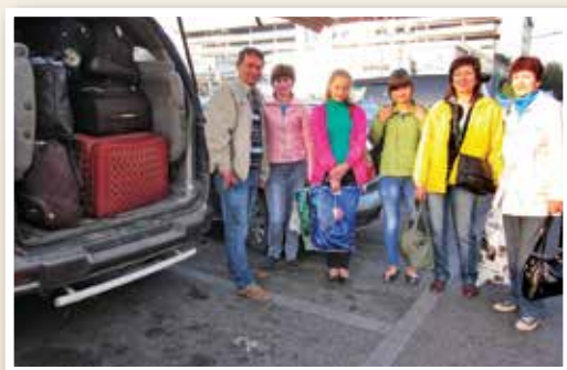
!De camino a una vida mejor!

La familia esta muy agradecida por nuestra amistad y ayuda para emprender su aliyah. Para ellos y los otros a quienes podemos ayudar, la Palabra de Dios dice: "Porque yo sé muy bien los planes que tengo para ustedes – afirma el Señor – planes de bienestar y no de calamidad, a fin