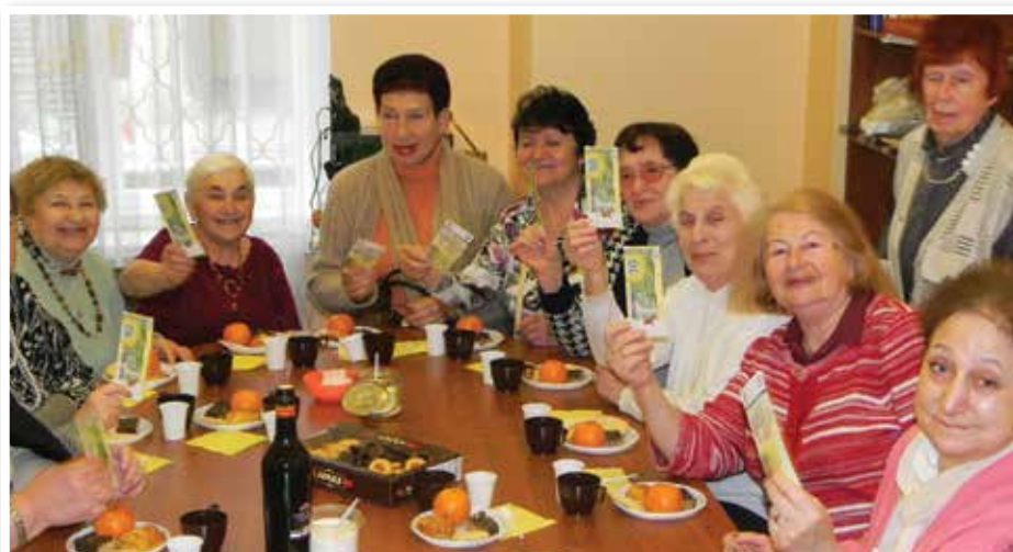
Sobrevivientes del Holocausto con sus tarjetas para compra comida

Creemos que la región Báltica tendrá una gran importancia estratégica en el futuro como un portal para que el pueblo Judío regrese a Israel. Por favor oren mientras que construimos las fundaciones del trabajo con la ayuda de la Iglesia.