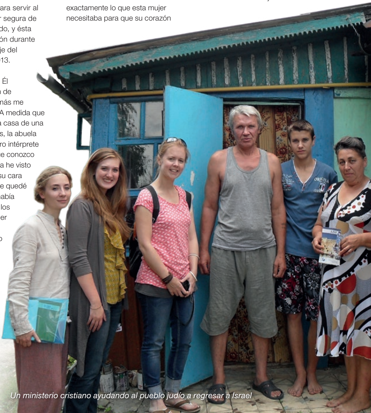
Un ministerio cristiano ayudando al pueblo judío a regresar a Israel

A medida que expliqué el corazón y el plan de Dios para esta mujer y su pueblo, grandes lágrimas comenzaron a