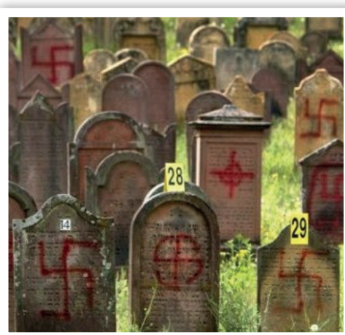
Lápidas judías profanadas.

pueblo judío enviando una carta a la comunidad judía de Roma y al Embajador de Israel en nombre del ministerio de Ebenezer en su conjunto. Nuestro mensaje fue 'Aquellos que les ofenden, nos ofenden a nosotros.' Continuamos ayudando y consolando al pueblo judío en Italia en cada oportunidad, animándolos a prestar atención a las señales de alarma de estos ataques, regresando a Israel.