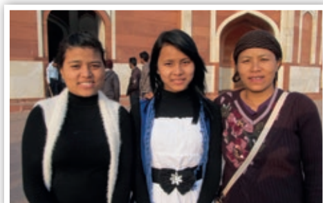
Madre Bnei Menashe con sus dos hijas.

ser testigo de la fidelidad de Dios, el gozo de sentir Su sonrisa sobre el regreso de Su pueblo amado a la Tierra Prometida!