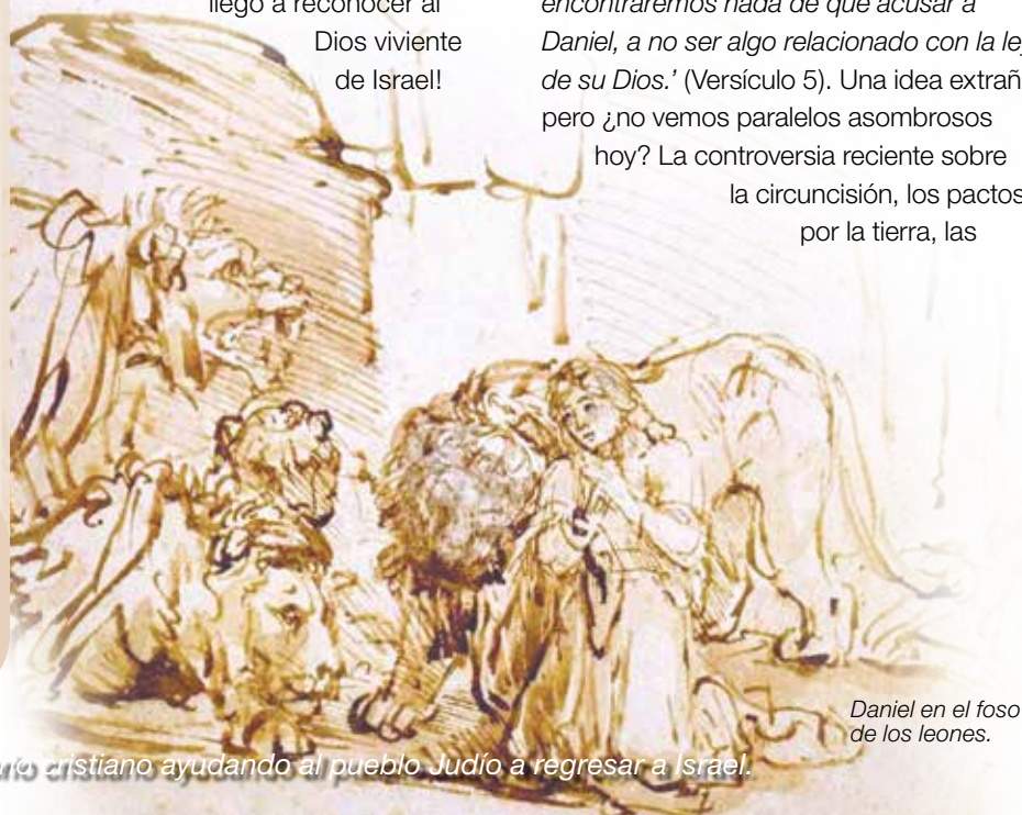
Daniel en el foso de los leones.

¡Puede ser que nos sorprenda, pero cuando Daniel sirvió a Darío como un gobernador altamente valorado, de repente se involucró en el aliyá! Estudió las escrituras, entendió los tiempos y comenzó a prepararse para el regreso de su pueblo desde el cautiverio en Babilonia a Israel mediante la oración, la súplica (petición) y el ayuno (Daniel 9:1-3) Daniel en el foso de los leones (capítulo 6) es una de las historias más queridas de la Biblia. ¡Este incidente fue, de hecho, un ataque contra el aliyá! ¡El enemigo intentó eliminar a Daniel para impedir el regreso de los Judíos! Sucedió justo después de que el Rey Darío hubiese promovido a Daniel a su alta posición. Por envidia, sabiendo que Daniel era Judío, sus compañeros del gobierno y los sátrapas hicieron un plan diabólico a fin de deshacerse de él. Dijeron: 'Nunca encontraremos nada de qué acusar a Daniel, a no ser algo relacionado con la ley de su Dios.' (Versículo 5). Una idea extraña, pero ¿no vemos paralelos asombrosos hoy? La controversia reciente sobre la circuncisión, los pactos por la tierra, las