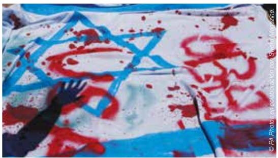
Una bandera israelí maltratada sobre el suelo durante una protesta en contra de las operaciones militares de Israel en la franja Gaza. La Paz, Bolivia, noviembre de 2012.

Por Markus Ernst Presidente de Ebenezer Fondo de Emergencia Internacional